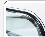
Vetri laterali e frontale curvi