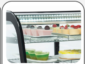
Luce LED interna