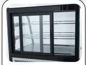
Porte scorrevoli posteriori